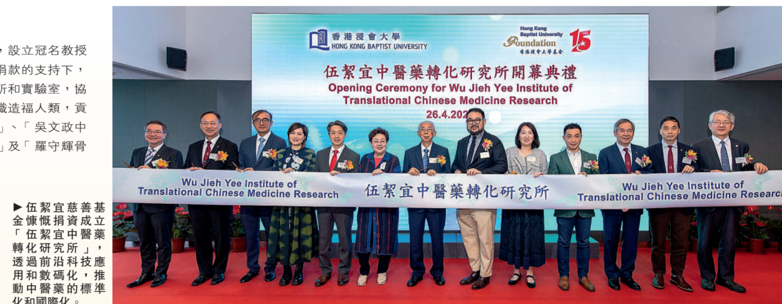
▲伍潔宜慈善基金慷慨捐資成立「伍潔宜中醫藥轉化研究所」，透過前沿科技應用和數碼化，推動中醫藥的標準化和國際化。