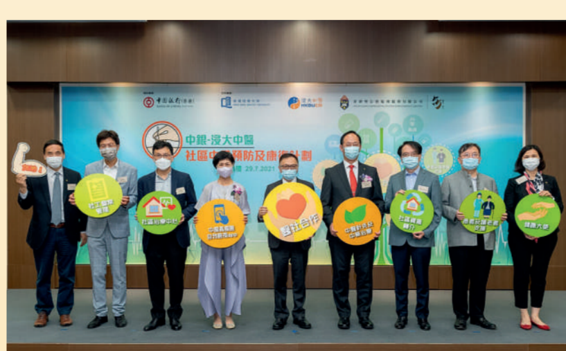
▲浸大及香港聖公會福利協會有限公司獲中國銀行（香港）有限公司支持，推行「中銀—浸大中醫社區中風預防及康復計劃」，為合資格的中風長者提供免費的中醫康復治療。

浸大矢志服務社會，造福人群。浸大師生善用其專業知識及應用研究成果，連繫社群，應對社會上各項需要。承蒙各界捐獻，浸大得以開展不同類型項目，協助社區開展新的服務方式，樹立典範。