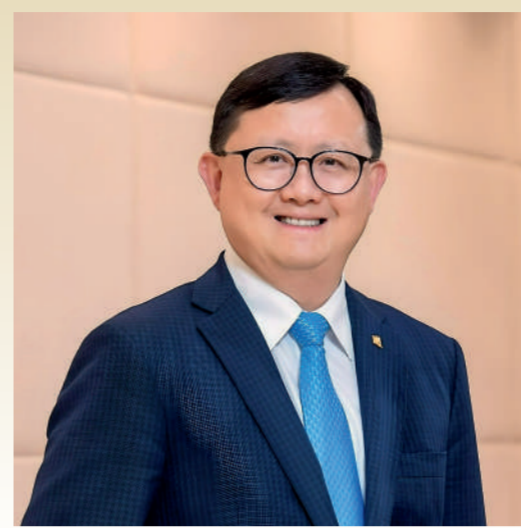
香港浸會大學基金董事局主席 黃英豪議員，BBS, JP

香港浸會大學基金致力凝聚各界有識之士，熱心推動大學的長足發展。歷年來，基金會員人數穩步上升。即使在金融海嘯期間，以至近年社會面對種種挑戰，我們的支持者依然鼎力襄助，為浸大籌得可觀的資源。這股龐大的力量不僅推動大學在教學和研究方面屢創佳績，還成就多項嶄新且獨特的項目，惠澤社群，貢獻國家。我衷心感謝每一位支持者，你們的捐助讓浸大締造豐碩的成果，培育更多未來的領袖。