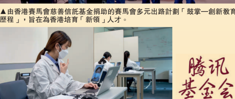
▲騰訊公益慈善基金會於新冠疫情期间資助浸大中醫藥學院的抗疫行動，成立「浸大中醫抗疫服務隊」。