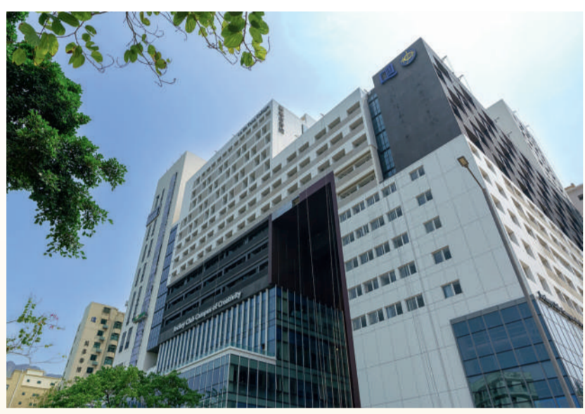
▲香港賽馬會慈善信託基金撥出港幣 4.52 億元捐款支持興建賽馬會創意校園，是浸大歷來最大額單一捐款。校園部分設施已於本年 9 月啟用。

基金歷年來籌募所得的資源，協助大學實現教育使命。大學訂定了《策略發展計劃 2018-2028》，致力為學生提供最佳的學習體驗，增強實力和優勢，以開拓世界級研究，目標成為一所領先亞洲、立足世界的博雅大學。為達成此目標，浸大將集中資源發展四大重點研究領域，即「創意媒體」、「健康與藥物研發」、「人文及文化」以及「數據分析與人工智能應用」，進一步推動跨學科協作和研究，開拓知識前沿，在學術上力爭領先地位，以配合香港、國家、地區以至全球的整体發展。