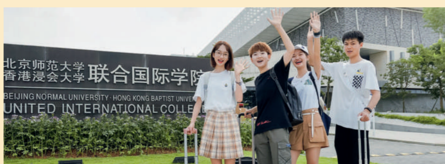
▲大灣區延伸學習計劃