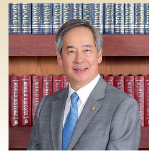
香港浸會大學校董會暨諮議會主席 陳鎮仁博士，GBS, JP

香港浸會大學基金致力凝聚各界有識之士，熱心推動大學的長足發展。歷年來，基金會員人數穩步上升。即使在金融海嘯期間，以至近年社會面對種種挑戰，我們的支持者依然鼎力襄助，為浸大籌得可觀的資源。這股龐大的力量不僅推動大學在教學和研究方面屢創佳績，還成就多項嶄新且獨特的項目，惠澤社群，貢獻國家。我衷心感謝每一位支持者，你們的捐助讓浸大締造豐碩的成果，培育更多未來的領袖。