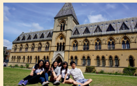
▲第一代大學生基金