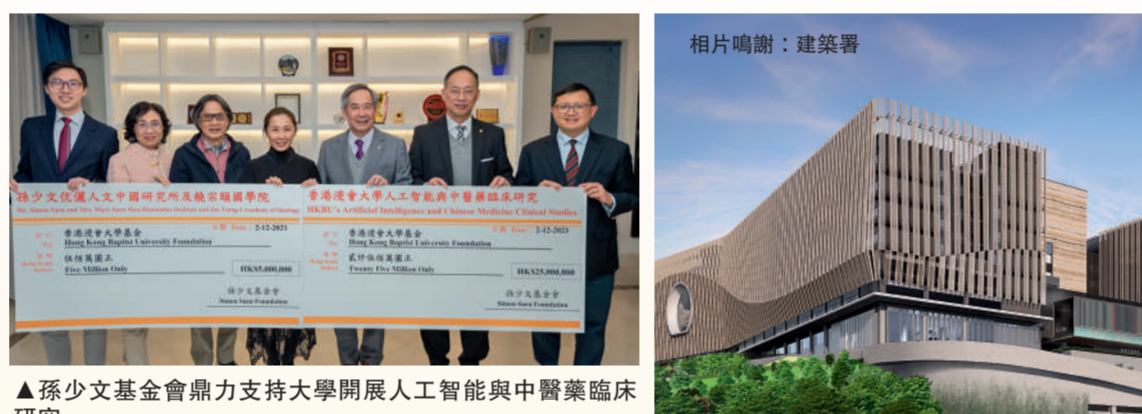
▲孫少文基金會鼎力支持大學開展人工智能與中醫藥臨床研究

多年來，基金一直協助大學推動各項開創性及前瞻性的項目。重點創新項目包括支持浸大協助香港中醫醫院的籌備工作；成立香港首個創意研究院、全港首個新聞工作者訪問學人計劃、以及創辦一系列推動學術及業界發展和培育人才的獎項，包括「中醫藥國際貢獻獎」、「全球大學電影獎」及「紅樓夢獎」等。