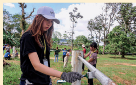
▲創新服務學習課程