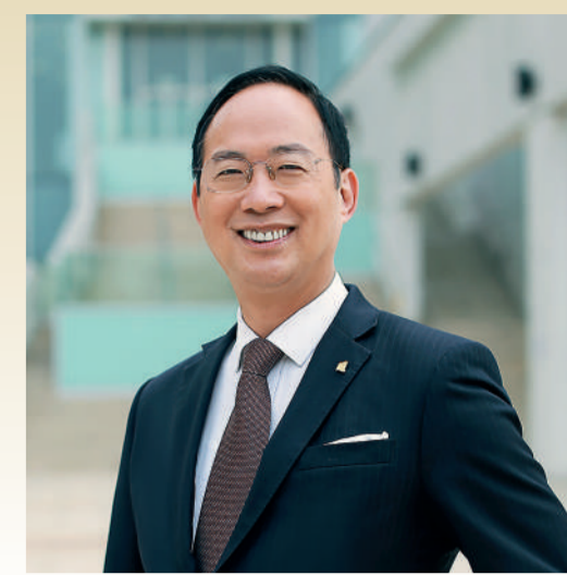
香港浸會大學校長 衛炳江教授，JP

香港浸會大學基金是浸大的重要籌款平台。在過去 15 年裡，基金籌募的資源引領浸大開拓前沿研究，突破知識界限，擴闊學生眼界，培育德才兼備的學子。基金積極與各界合作，集結力量，對浸大的教學和研究帶來深遠影響。浸大正在推動多項重要項目，包括香港首間中醫醫院、打造「一校兩區」、重建善衡校園，以及優化校園設施。我誠摯邀請大家與香港浸會大學基金攜手，資助大學推動這些關鍵項目，共同開創更美好的未來。