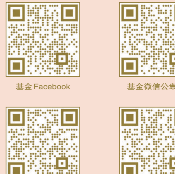
基金 Facebook 基金微信公眾號 基金 YouTube 香港浸會大學發展事務處微博

浸大謹此向所有支持香港浸會大學基金的捐款人和機構致以衷心謝意。我們熱切期盼更多人能加入基金，您的支持將為大學締造成果，孕育更多傑出的未來人才。