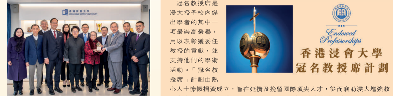
▲冠名教授席是浸大授予校內傑出學者的其中一項最高榮譽，用以表彰獲委任教授的貢獻，並支持他們的學術活動。「冠名教授席」計劃由熱心人士慷慨捐資成立，旨在延攬及挽留國際頂尖人才，從而襄助浸大增強教研實力，開拓各知識領域，啟迪後學並為社會培育英才。自 2006 年推出以來，多個冠名教授席先後設立，涵蓋中醫藥、數據科學、環境研究、人文、傳媒以至音樂等不同學術範疇。各冠名教授席負有重任，致力帶領浸大開展創新研究、促進知識轉移，以及為各行各業栽培未來領袖，推動社會進步。